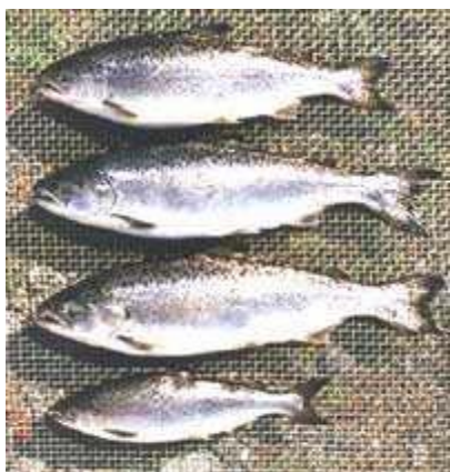
Cuatro especímenes de salmón de la misma edad. Los tres superiores son transgénicos para la hormona de crecimiento. el cuarto es un salmón silvestre.